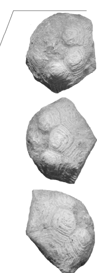
↑ Textfigur 3 Stratigraphische Übersicht der mitteldevischen Schichtglieder der Eifelkalkmulden aus HAUSER, 2001; rechts: Holotyp von Cupressocrinites inusitatus HAUSER, 2016 vom Gondelsheimer Acker