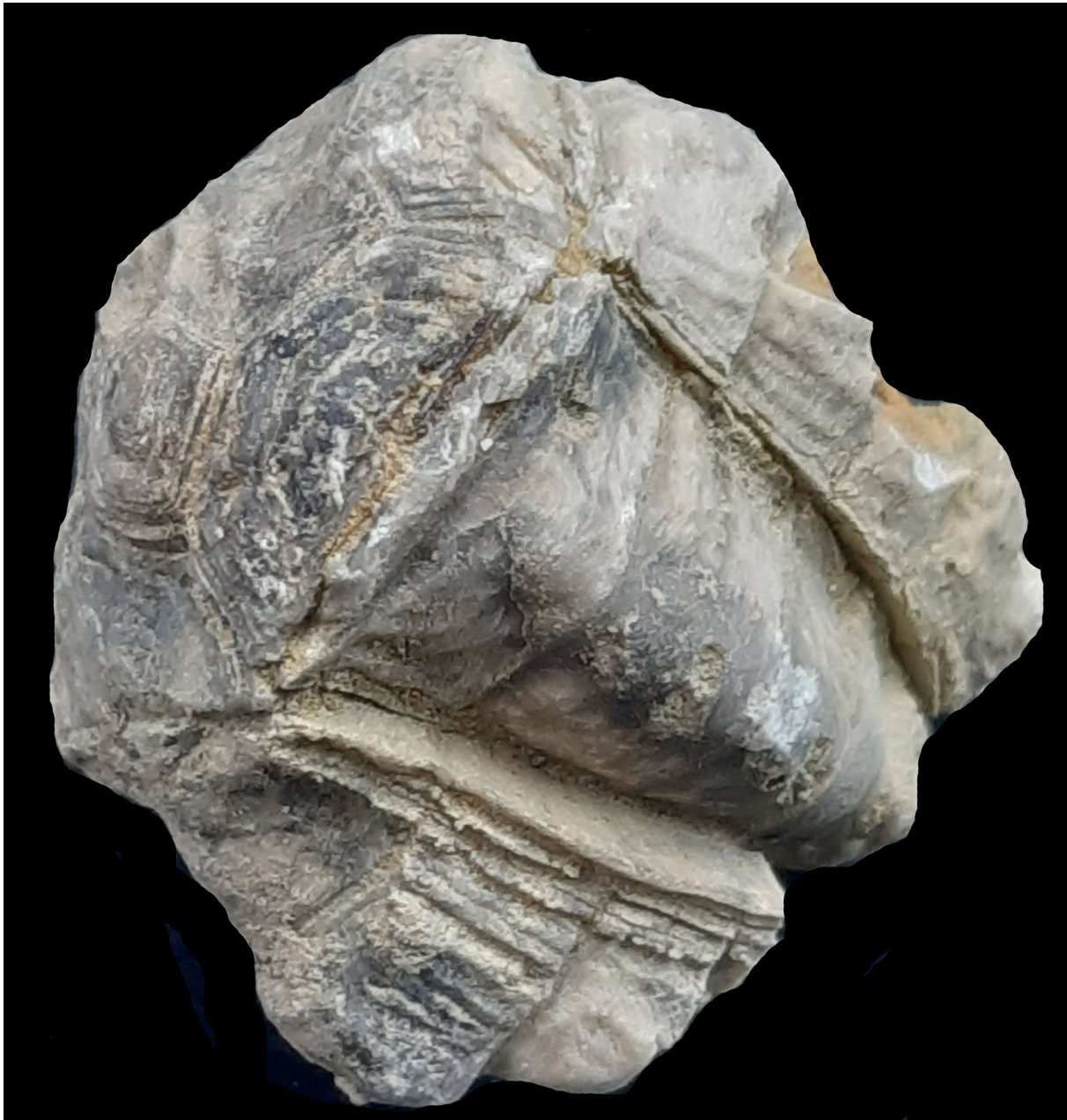
↑ Textfigur 1 : Cupressocrinites inusitatus HAUSER, 2016

Anlässlich einer Eifelexkursion im März 2024 in die Prümer Mulde wurden die nun schon fast als klassisch zu bezeichnende Fossilfundstellen abgefahren. Denkt man an die Monographien des Verfassers aus den Jahren 2008 und 2010 würde man wohl kaum Funde erwarten, die unsere Kenntnisse der fossilen Welt des Devons im wesentlichen Umfang erweitern. Die Ackerfläche W der Ortsgemeinde Gondelsheim mag angesichts des nachfolgend beschriebenen Fundes hier eine Ausnahme darstellen: denn die Krone wurde am Ackerrand auf einem kleinen, abgeregneten Mergelhügel, 5 Minuten nach dem Abstellen des PKW's beim ersten hinsehen gefunden. Bemerkenswert ist, daß die Ackerfläche nicht gepflügt war.