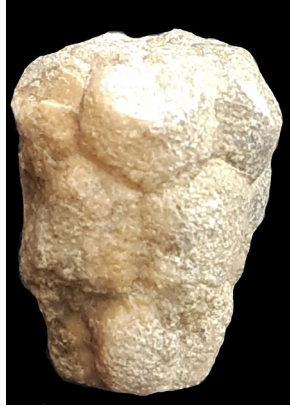
↑ Textfigur 2: Bactrocrinites muelleri JAEKEL, 1895, Highlight der Fundausbeute einer Eifelxkursion Ende März 2024 (im nördlichen Teil der Ackerfläche, vermutlich Grenze Heinzeltium/Graubergium der Junkerberg Formation)

Über die Brachia von Cupressocrinites inusitatus HAUSER, 2016 (Crinoidea, Camerata) aus dem Grenzbereich Heinzeltium/Graubergium der Junkerberg Formation vom Gondelsheimer Acker (Prümer Mulde, Eifel)